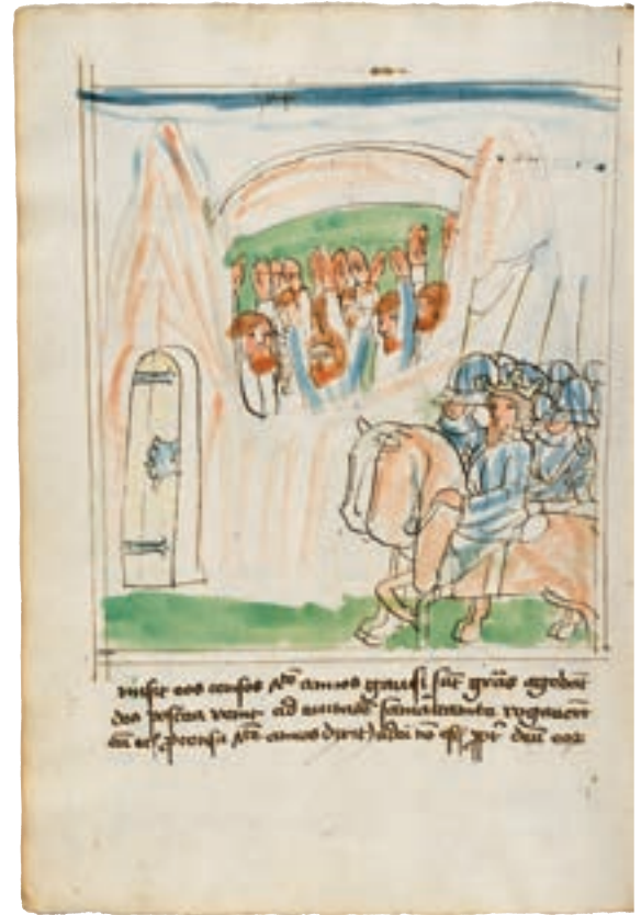
7 In einer illustrierten Historienbibel (Bild rechts) aus dem 15. Jahrhundert, die die Einschließung der Roten Juden durch Alexander zeigt, haben sie rötliche Haare und Bärte. Der mazedonische König ist im Gegensatz dazu blond dargestellt.