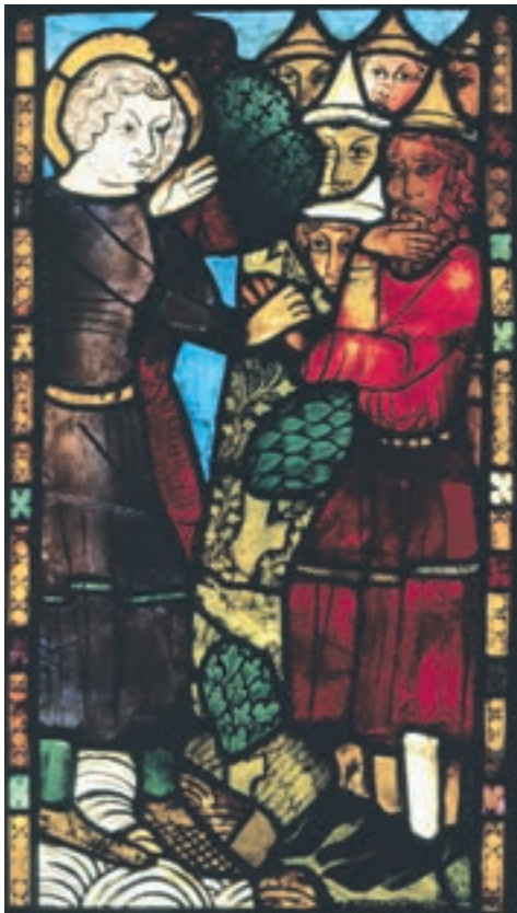
6 Die Farbe Rot war im christlichen Europa häufig stark negativ konnotiert (Bild links). Rote Haare, die in allen ethnischen Gruppen schon immer rar waren, galten aufgrund ihrer Abweichung von der Norm als ein äußeres Zeichen für einen schlechten und hinterhältigen Charakter. Die Roten Juden, die die ultimativen jüdischen Übeltäter symbolisierten, die letzten und größten Widersacher Christi, die mit seinem Erzfeind, dem Antichrist, unter einer Decke steckten, personifizierten die negative Konnotation der Farbe Rot. Entsprechend stellt das Frankfurter Antichristfenster sie mit roten Gewändern und roten Gesichtern dar, um ihre Gefährlichkeit und Streitbarkeit zu unterstreichen.

der sich von seinem Vater Isaak das Erstgeburtsrecht erschleicht und damit zum Stammvater des Volkes Israel wird. So wie die Juden sich mit Israel identifizierten, so beanspruchte die christliche Kirche aufgrund der Annahme, dass die göttliche Erwählung auf sie übergegangen war, selbst ebenfalls die Identität des siegreichen Israel (»verus Israel«) und wies die Rolle des unterlegenen, verworfenen Edom nun ihrerseits den Juden zu.